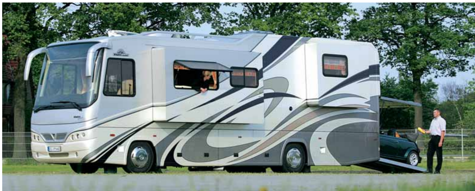
Vario Perfect: In der Premiumklasse verwirklicht Vario Mobil reisemobile Träume. Erker und Garage gehören selbstverständlich dazu.

Den Traum vom individuellen Luxus auf Rädern setzt Vario Mobil in die Tat um. Seit 1984 fertigt die Manufaktur in Bohmte bei Osnabrück Sonderfahrzeuge und Reisemobile der Superlative. Jährlich rollen etwa 35 reisetaugliche Flaggschiffe aus den Fertigungshallen – Stück für Stück von Hand gefertigt und den Wünschen der Kunden individuell angepasst. Unikate eben. Daneben entstehen im Osnabrücker Land auch Sonderfahrzeuge, beispielsweise für mobile Ausstellungen.