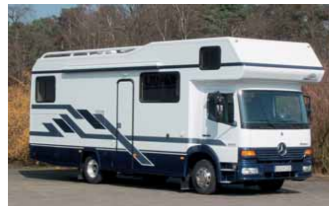
Vario Alkoven 850: großzügiger Grundriss für reisefreudige Familien.