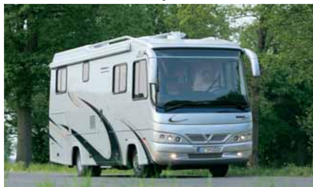
Vario Perfect: Traumobil auf luftgefedertem Lkw- oder Omnibus-Chassis.