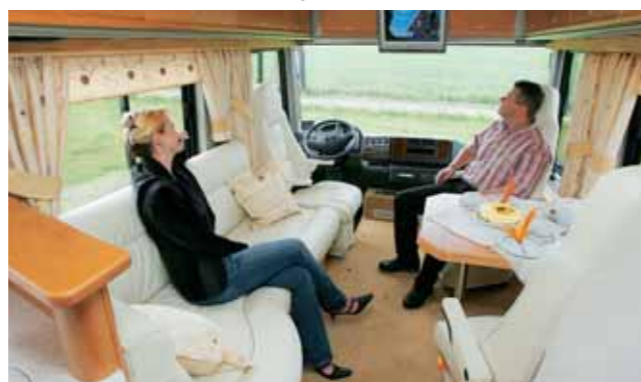
Vario Perfect: Einrichtung und Grundriss nach individuellem Kundenwunsch.