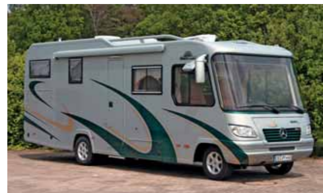
Vario Star 800: kompakter Integrierter der gehobenen Klasse.