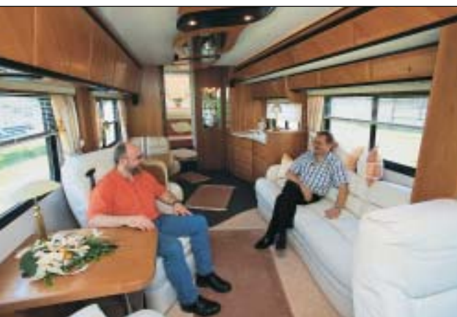
Der perfekt eingepasste Slide-out unterstützt den weitläufigen Raumeindruck unauffällig, aber wirksam.

Info: Tel. 05 47 41/9 51 10, www.vario-mobil.com