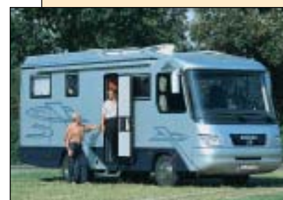
Star 800: Den kleinen Perfect-Bruder gibt es wahlweise auf MAN.

Der Vario Star ist in der hausinternen Hierarchie so etwas wie die Einsteigerbaureihe, auch wenn das bei Preisen ab rund 137 000 Euro fast etwas vermessen klingt. Die kleineren Star-Modelle 650 und 700 ruhen auf relativ volkstümlichen 416er-Sprinter-Chassis von