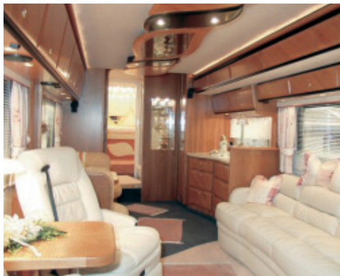
Edel: Feinste Materialien dominieren den Innenraum.

Superlative dominieren auch im Innern des aus 46 Millimeter dicken Wänden bestehenden Wohnaufbaus, der im vorderen Bereich links einen 4,10 Meter langen Erker und im Heck eine Pkw-Garage beinhaltet. Das zeigt schon